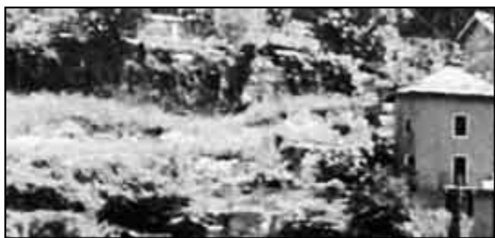
L'area verde a sinistra della ex-filanda fino si poteva ammirare fino a qualche mese fa dal lago. Ora si vede un cantiere: sono in corso i lavori per la costruzione dell'autosilo