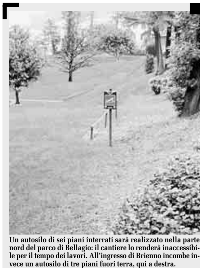
Un autosilo di sei piani interrati sarà realizzato nella parte nord del parco di Bellagio: il cantiere lo renderà inaccessibile per il tempo dei lavori. All'ingresso di Brieno incombe invece un autosilo di tre piani fuori terra, qui a destra.

Nesso, Carate, Bellagio e Brieno: sul lago si moltiplicano le autorimesse La Soprintendenza: «Forte impatto». Ma il bisogno di parcheggi prevale