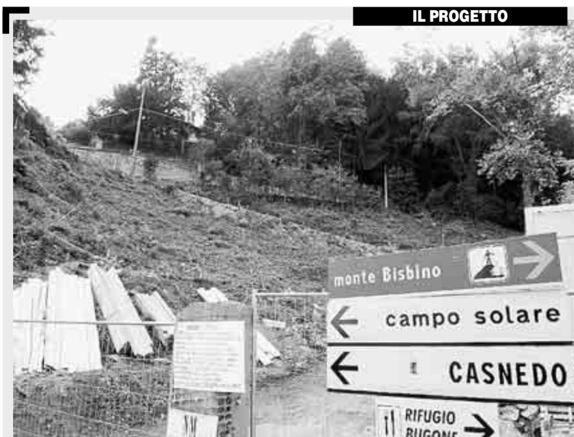
Nell'immagine qui sopra, il colle di Casnedo, luogo dove sorgerà il cantiere per otto abitazioni e 17 posti auto, in osservanza al piano regolatore approvato dal Comune fra le polemiche a fine anni '90, quando era sindaco Giulio Isola. A destra, ecco il progetto realizzato dal noto architetto comasco Mario Margheritis

Il progetto ha subito una lunga istruttoria e il sindaco Simona Saladini conferma di «essersi impegnata per